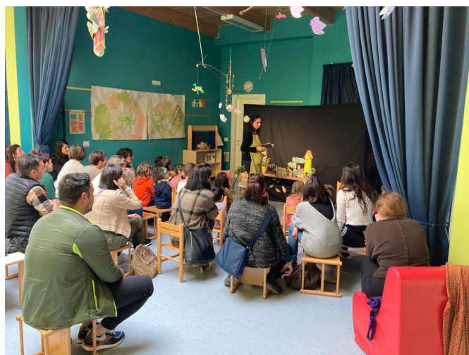
Spettacolo Teatro di Figura per famiglie

Il Nido d'infanzia funge da collegamento tra le famiglie e i servizi del Centro per le famiglie “Giovanni Paolo II” (Sportello di consulenza psicologica, laboratori per bambini, corsi per genitori ecc. ).