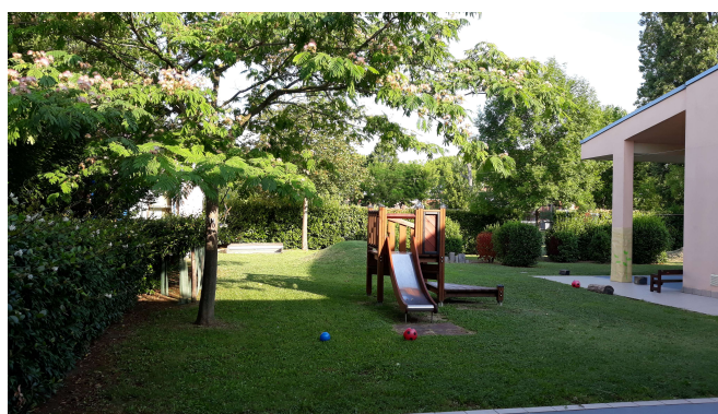
Giardino esterno (Sezione Piccoli)