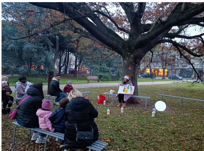
Lecture al Parco Giovanni Paolo II (Parco del Comune)

Per la realizzazione dei progetti il nido si avvale dei servizi educativi territoriali – collaborazione con la Biblioteca comunale “A. Panzini” – attuando percorsi mirati e condivisi.