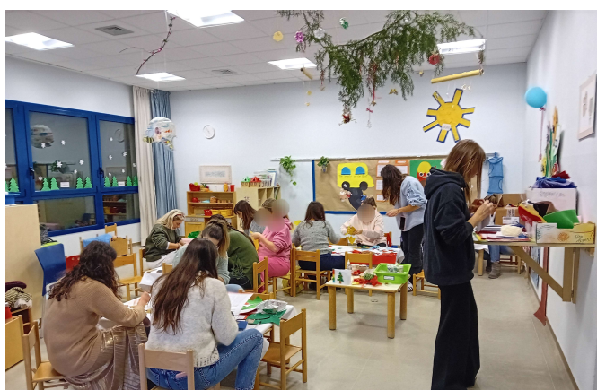
Laboratorio per genitori

In quest'ottica si costituiscono organi e momenti di gestione e partecipazione articolati su diversi livelli contestuali, che si realizzano attraverso momenti di incontro informali (feste, gruppi di lavoro ecc.) e con l'organizzazione di spazi di incontro formali (assemblee di plesso e di sezione, colloqui individuali ecc.).