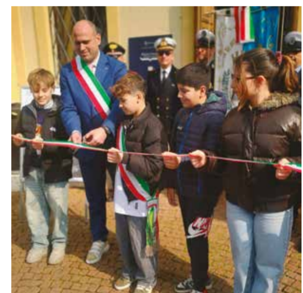
70 anni di Noi: Buon compleanno Bellaria Igea Marina

Seguici sui nostri profili e resta aggiornato sul nostro website